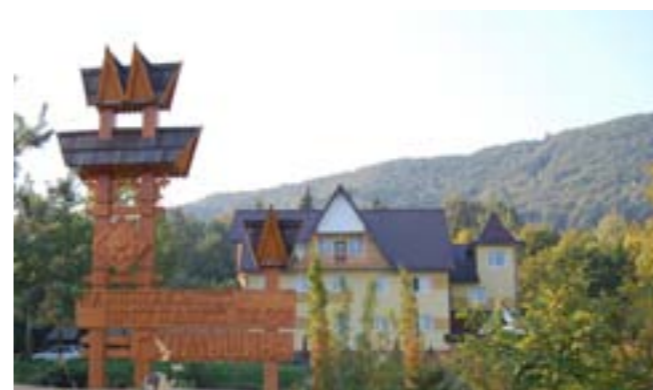
Адміністративне приміщення в м. Косові