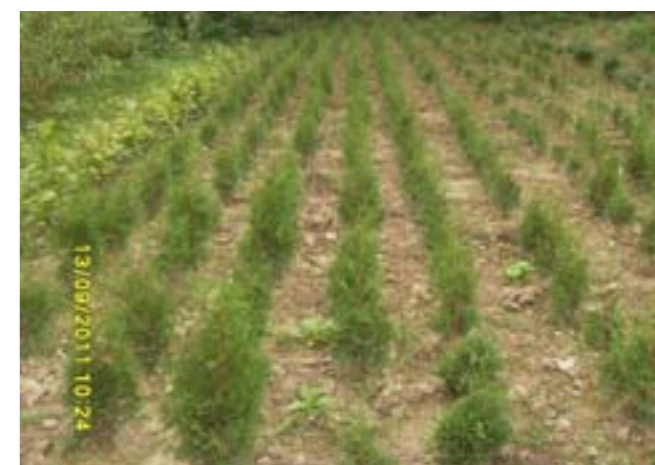
Розсадник Старокутського ПНДВ