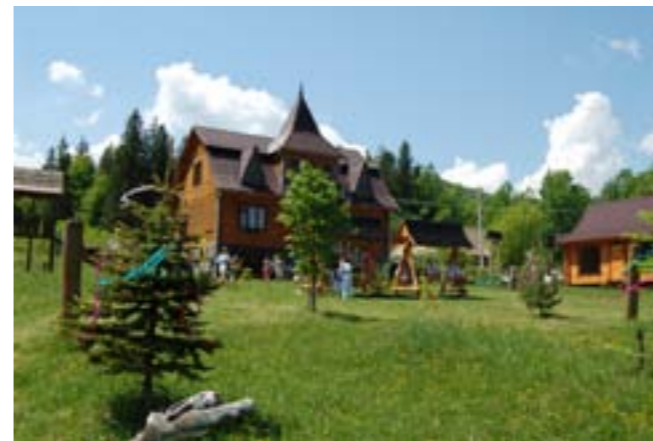
Маєток Святого Миколая в с. Пістинь