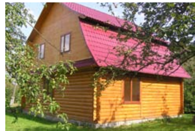
Рекреаційний будинок в с. Шешори