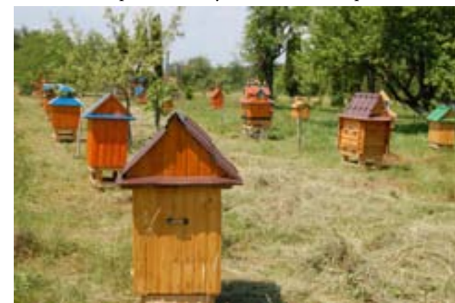
Пасіка Святого Миколая в с. Кобаки