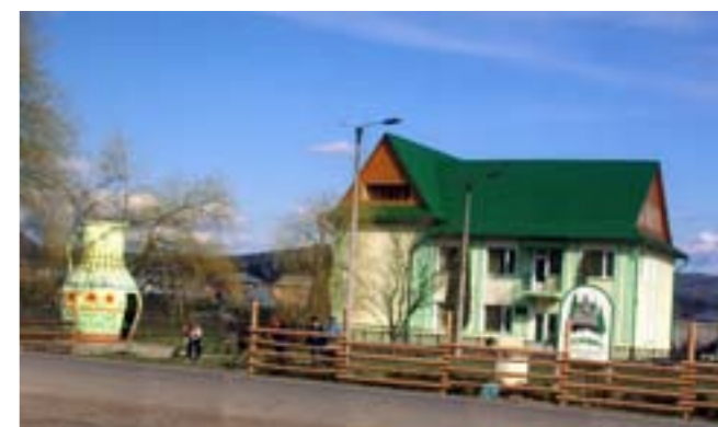
Лабораторно-експериментальний корпус в с. Смодна