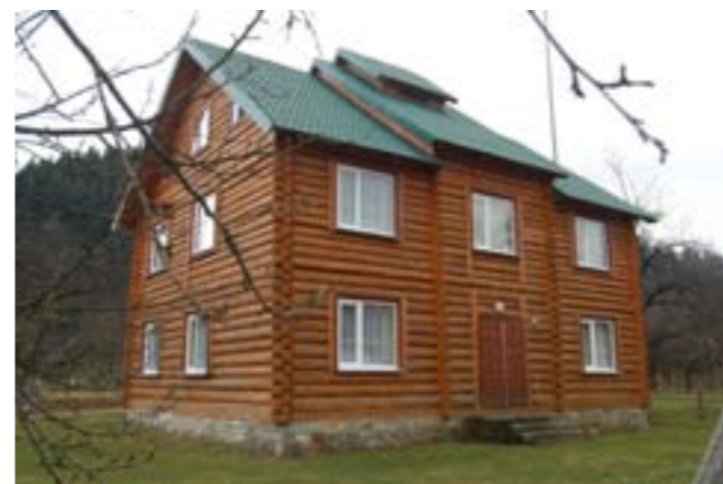
Рекреаційне містечко “Шешори”